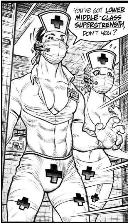
Ill 1: Adam Warren, Empowered , Dark Horse Comics, Inc.