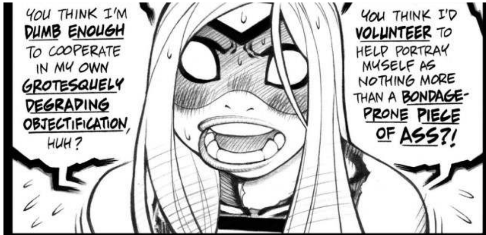
Ill 3: Adam Warren, Empowered , Dark Horse Comics, Inc.